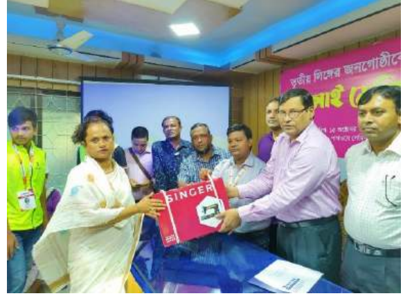
তৃতীয় লিঙ্গের জনগোষ্ঠীর মাঝে সেলাই মেশিন বিতরণ ও আর্থিক সহায়তা প্রদান।