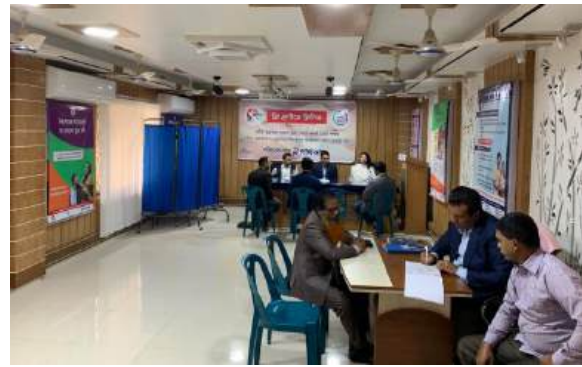
ফ্রি মেডিকেল ক্যাম্পেইন সমূহ