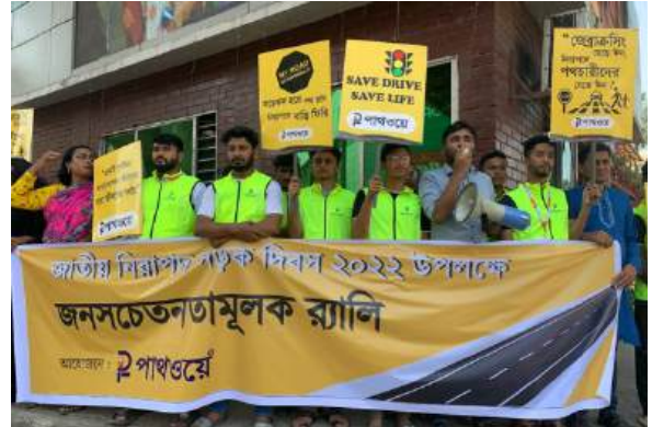
নিরাপদ সড়ক দিবস উদযাপন