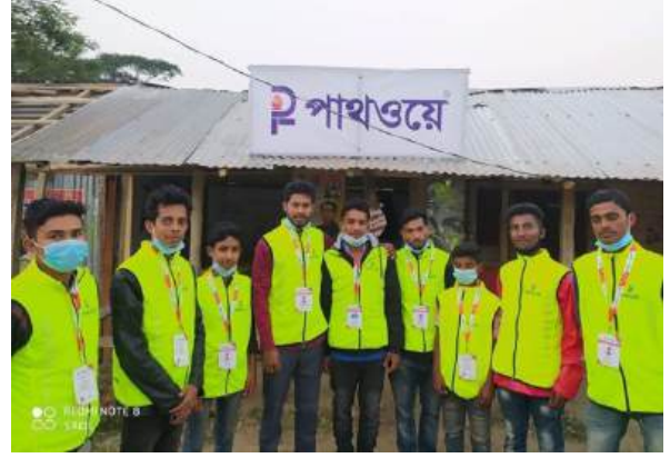
বৃক্ষরোপণ ও ভলান্টিয়ারিং কার্যক্রম