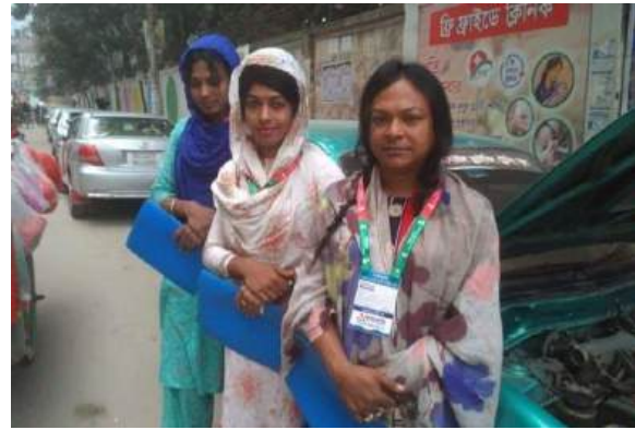
তৃতীয় লিঙ্গের জনগোষ্ঠীকে ড্রাইভিং প্রশিক্ষণ