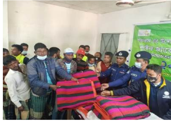
শীতবস্ত্র বিতরণ কার্যক্রম