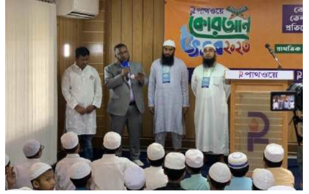
পাথওয়ে কোরআন উৎসব ২০২৩ ইং