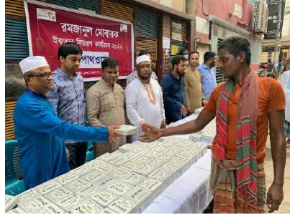
পবিত্র মাহে রমজানে ইফতার বিতরণ কর্মসূচি